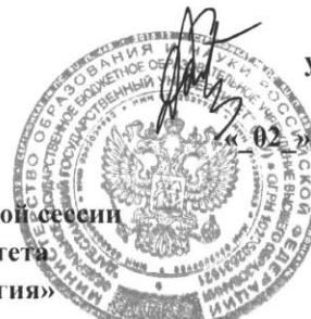
График зимней зачетно-экзаменационной сессии филологического факультета по направлению «Филология» (Русский язык и литература; родной язык и литература) 2018-2019 учебного года